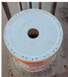
Figura 10: Biofiltro com destaque para furos no fundo do balde.

O biofiltro será feito com um balde de 16 litros, fazendo-se um furo de ¾ (25 mm) no centro do fundo do balde. Com uma furadeira e uma broca de 2-3 mm, faça furos espaçados de 2 cm ao redor da borda do fundo do balde. Tais furos são usados para prender a cabeleira. Use o pedaço de 25 cm do cano de 1/2" (20 mm), soldável, e faça 10 furos de 3 mm em sua extensão (Figura 10). É muito importante que os furos no pedaço de cano fiquem exatamente com o diâmetro indicado. Se os furos ficarem maiores que o tamanho indicado, a pressão da água será insuficiente para o jato recomendado; se ficarem menores que o tamanho indicado, haverá um desgaste da bomba SB 2000, reduzindo sua vida útil.