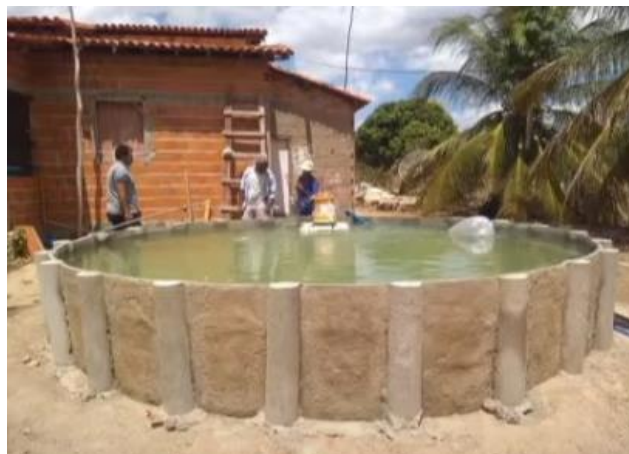
Figura 6: Demonstração do tanque pronto.