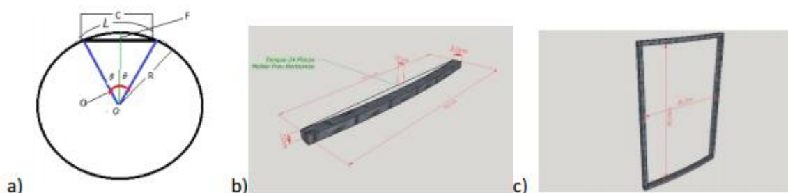
Figura 7. a) Representação da circunferência do tanque com os indicadores usados no cálculo das medidas da forma. L (Arco); C (Corda); R (Raio); F (Flexa); \alpha (ângulo central); \theta semi-ângulo central; o (origem) b) Representa a peça e a indicação das medidas para fabricação da forma e c) a forma com suas medidas internas.

As Figuras 7 (a, b, c) representam os pontos de obtenção das medidas para o cálculo da forma.