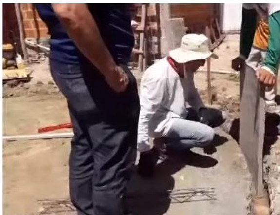
Figura 8: Demonstração da fixação das placas de concreto.

O metalon usado na confecção da forma é de 2x3 cm, onde a mesma terá formato retangular medindo 0,85 x 0,60 m (medida interna), utilizadas como molde para preparação das placas de concreto; confeccionadas com tubo retangular de Metalon galvanizado de 30x20x0,95 mm. Ele deve ser desenvolvido de modo a manter as medidas que definem a largura das placas em 3cm. A altura interna da forma de metalon (0,85) será diferente da altura do tanque (0,70 m), para facilitar a fixação das placas no solo e para compensar a altura do piso de 4 cm no fundo do tanque (Figura 8).