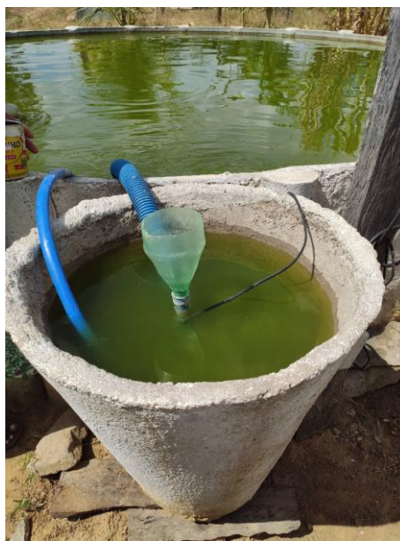
Figura 11: Demonstração do sedimentador.

A saída de água do tanque para o sedimentador externo será feita por sifão com retorno por bombeamento para o biofiltro antes de misturar com a água do tanque de forma equilibrada e estável.