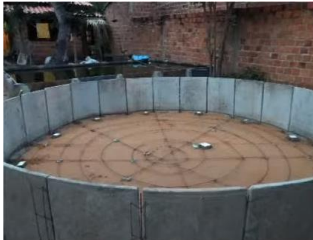
Figura 2: Demonstração da disposição das 24 placas.

A Figura 2 mostra a disposição das 24 placas formando a circunferência do tanque, um círculo.