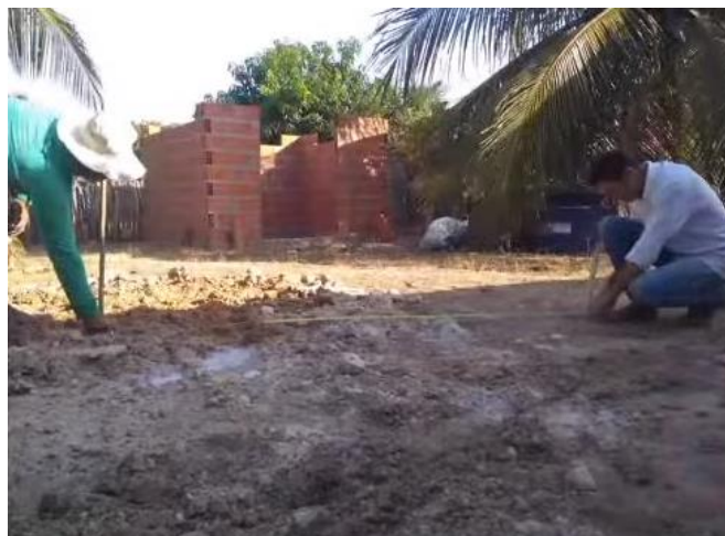
Figura 1: Demonstração da marcação do perímetro do tanque.

giratório que permite girar a linha sem que a mesma se enrole na estaca. Na outra extremidade dessa linha é presa a outra estaca com ponta, que será usada como compasso para riscar o solo, marcando a circunferência. Sobre a superfície do círculo, espalha-se o saibro. Em seguida ele deve ser molhado e compactado em toda a área do piso.