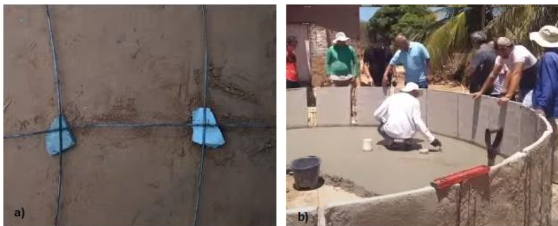
Figura 4: Detalhe da colocação dos calços de 2 cm e concretagem do fundo do tanque.